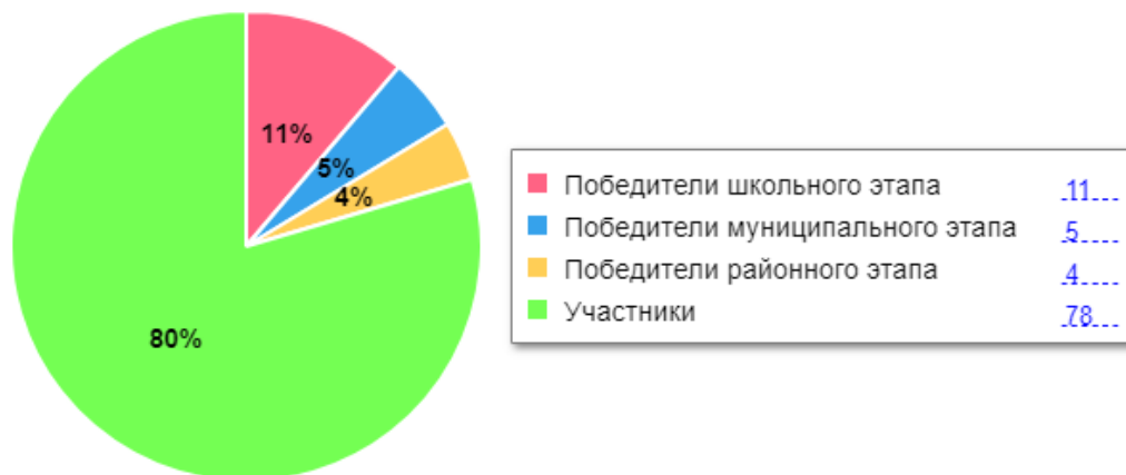
Диаграмма по результатам участия школьников во ВсОШ